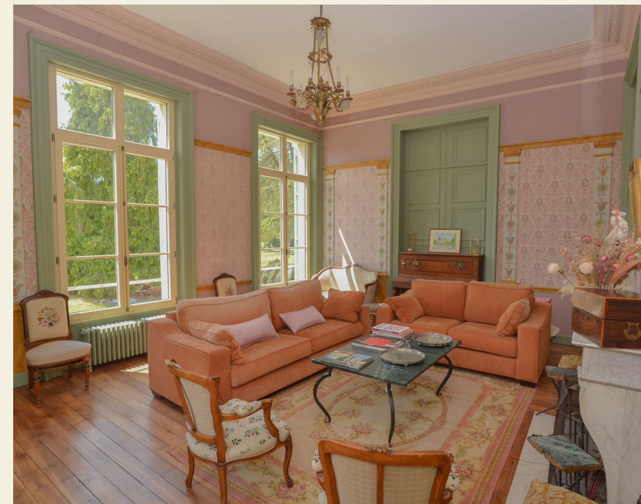
Le Petit Salon - 35m2