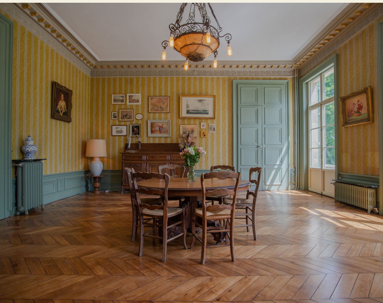
Le salon - 50m2