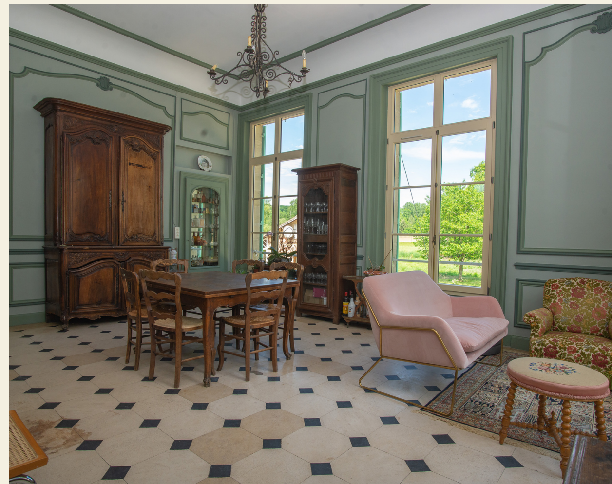
Le salon Vert - 35m2